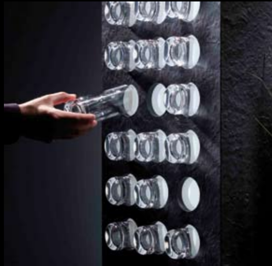
30 Gläser werden auf der Rückseite horizontal gelagert und effektiv hinterleuchtet.